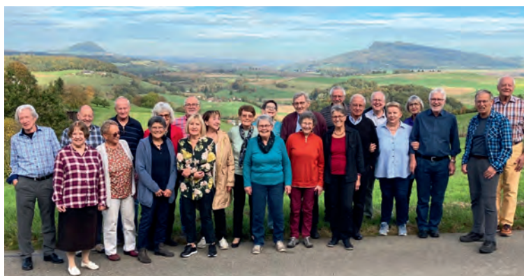
Erinnerungsbild vor der Kulisse der Hegauvulkane.

Während dem Apéro wurde frisch und fröhlich geplaudert und gelacht. So wurde wieder einmal über unsere damaligen Lehrer hergezogen, die damals noch sehr viel strenger waren als heute. So berichtete eine ehemalige Sek-Schülerin, dass sie die zu Hause vergessenen Schulunterlagen per sofort habe holen müssen (in Lohn, mit dem Velo). Heute müsste ein solcher Lehrer wohl mit einer Strafanzeige rechnen.