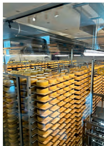
Blick ins Lager der Schaukäserei.