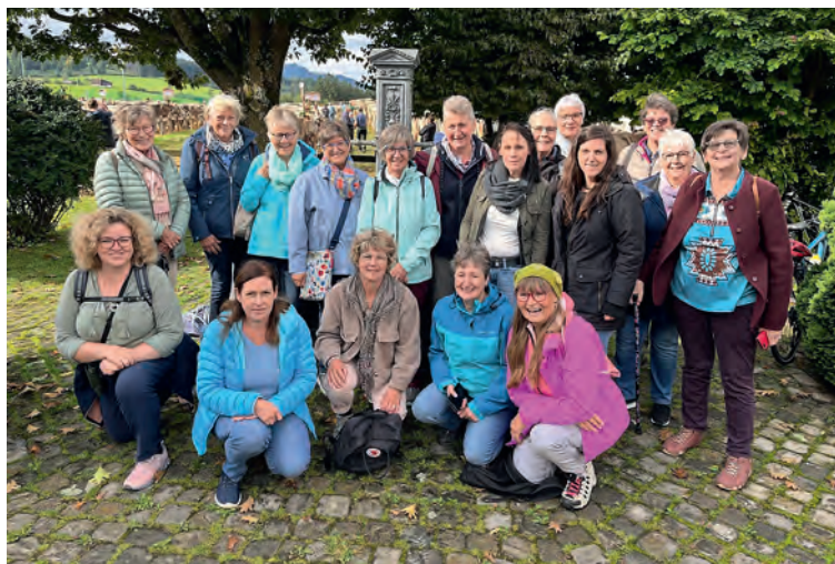
Erinnerungsbild des Ausflugs von Ende September.

Bei Kaffee und Kuchen haben wir uns verweilt, und der Nebel hat sich alles andere als beeilt. Nach dem Motto, das Beste kommt zum Schluss,