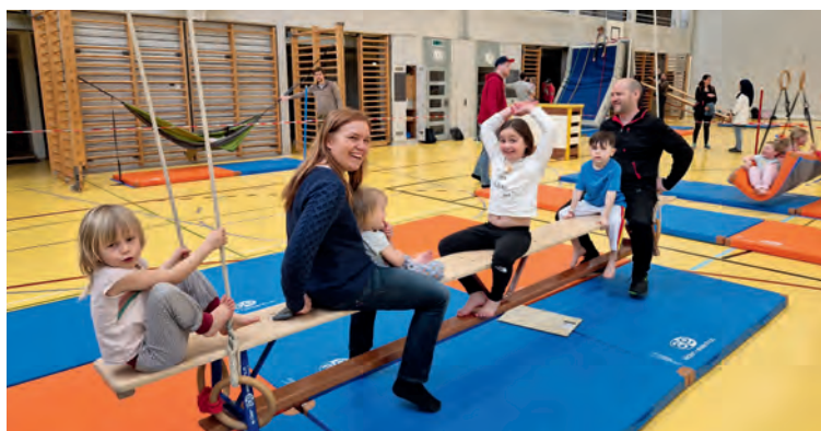
Die offenen Turnhallen sprechen die ganze Familie an.

Das kantonale Projekt «Family Day» startet in eine weitere Saison. Erneut öffnen sechs Turnhallen – eine davon in Thayngen – an mehreren Sonntagen ihre Türen für bewegungsfreudige Kinder und ihre Eltern.