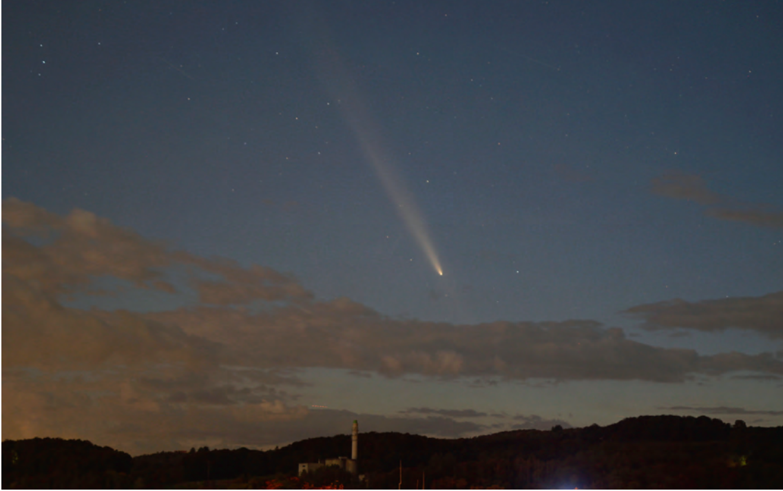
Der Komet Tsuchinshan-Atlas über der Zimänti am 14. Oktober, kurz nach 20 Uhr.

THAYNGEN Zurzeit sorgt ein Komet in den Medien für Schlagzeilen. Er heisst Tsuchinshan-Atlas und trägt die amtliche Bezeichnung C/2023 A3. Seit dem 10. Oktober ist er – sofern der Himmel klar ist – in den Abendstunden am Westhorizont von blossen Auge zu sehen. Von Tag zu Tag steigt er höher, verliert aber kontinuierlich an Strahlkraft. Ende des Monats wird er laut einem Bericht der schweizerischen Sendeanstalt SRF kaum noch sichtbar sein.