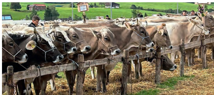
Die aufgereihten Kühe an der Vihschau.