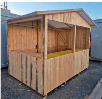
Der Prototyp der Holzhäuschen für den Weihnachtsmarkt.

... Häuschen bauen. Die Lernenden sind bei Mitgliedsfirmen des Gewerbevereins Reiat angestellt und sind