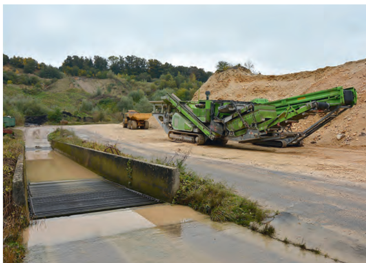
Ungefähr an diesem Ort ist die neue Deponie geplant.

Zurzeit läuft eine Vernehmlassung über eine Änderung der kantonalen Abfallplanung. Die Änderung sieht unter anderem vor, dass ab 2028 in der ehemaligen Tongrube Bibemeregg schwach verschmutztes Aushubmaterial und nicht recyclingfähige Bauabfälle deponiert werden.