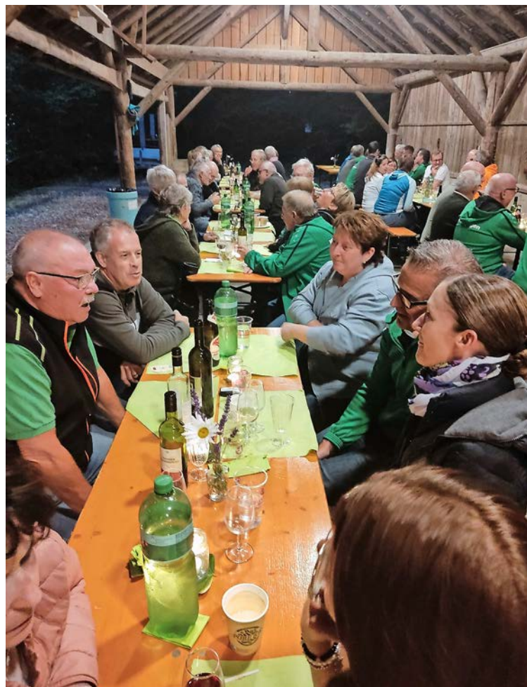
Männerriegler mit Partnerinnen im alten Schiessstand.