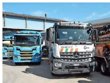
Die beiden Firmen bleiben eigenständig mit eigenem visuellen Auftritt.