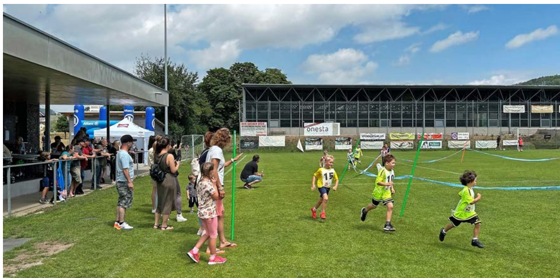
Die Jüngsten des FCT gaben alles, damit Geld in die Juniorenabteilung fliesst.

THAYNGEN Obwohl zahlreiche Mädchen und Jungs bereits am Samstag im Einsatz standen, liessen sie sich am Sonntag nichts anmerken. Mit voller Pulle begaben sie sich auf den 100-Meter-Rundkurs. Es galt, während zwölf Minuten möglichst viele Runden zu absolvieren. Dabei sah man unterschiedliche Taktiken: Die einen schlugen ein gar forsches Tempo zu Beginn an, andere wiederum liefen «taktisch» und konstant. Als sehr