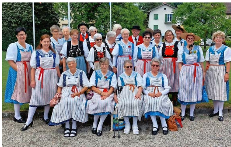
Die Reiater Reisegruppe auf ihrem Ausflug von letzter Woche.