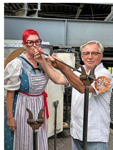
Eine Trachtenfrau bläst selber.