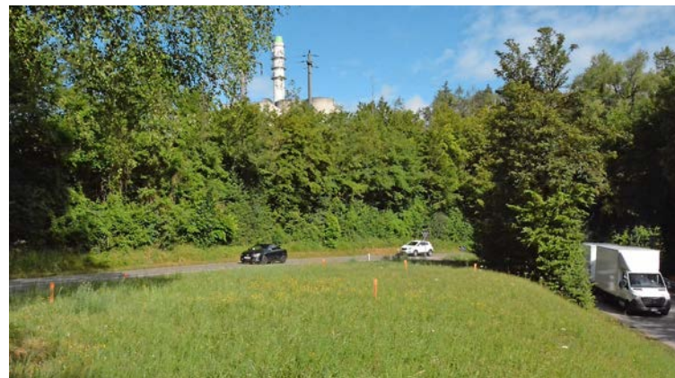
Bunte Holzpflocke markieren den Ort, wo der Kreisel geplant ist. Links ist die Alte Thayngerstrasse, die nach Herblingen führt, rechts die Schaffhauserstrasse, die zur A4-Einfahrt Kesslerloch führt. Bild: vf

führt werden muss, ist laut Tiefbaureferent Walo Scheiwiller eine gute Sache. «Das wird eine grosse Entlastung für Thayngen sein.» Vollständig der Vergangenheit angehören werden die chaotischen Zustände jedoch nicht. Ereignet sich nämlich ein Unfall auf der A4 zwischen Hauptzoll und der Ein-/Ausfahrt Kesslerloch, wird der Umleitungsverkehr weiterhin durch Thayngen fahren.