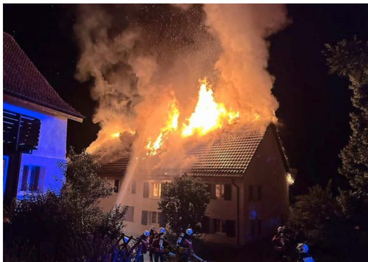
Das in Flammen stehende Haus an der Dorfstrasse.

Laut einer Polizeimeldung befand sich im Haus eine junge Frau, die aufgrund der Geräusche des Feuers aufwachte und sich selbstständig aus dem Haus begeben konnte. Aufgrund des Verdachts auf