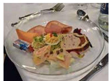
Ein reichhaltiger Vorspeisenteller eröffnet das Dreigangmenü.