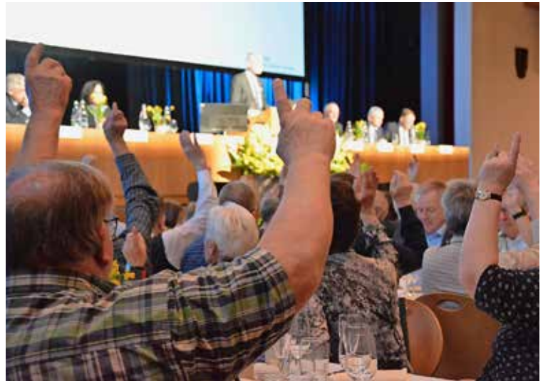
Die 383 anwesenden Aktionäre stimmen allen Geschäften der Generalversammlung einstimmig zu.