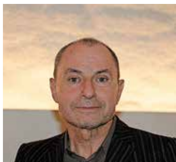
Norbert Gstrein, Autor des Romans «Vier Tage, drei Nächte».