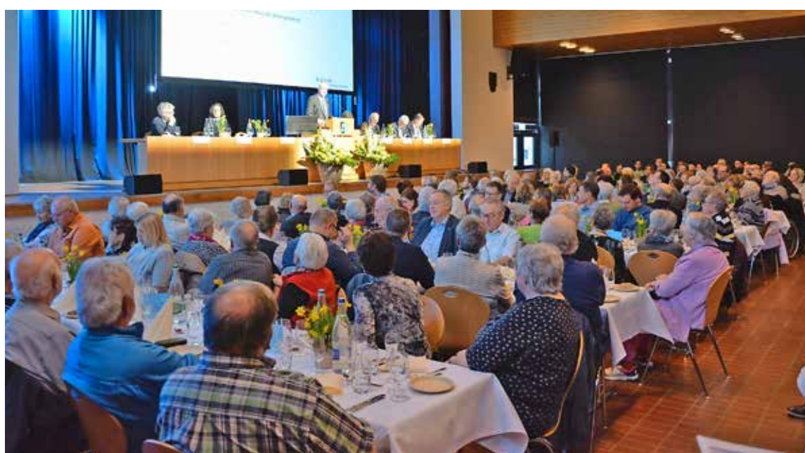
Die Clientis-Generalversammlung ist ein wichtiger Anlass im Thaynger Gesellschaftsleben.

Nicht nur für Demente Die Sunnegg ist schlecht ausgelastet. Deshalb vergrössert sie ihren Benutzerkreis. Seite 6