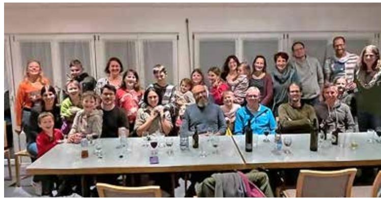
Das freiwillige Badipersonal hat guten Grund zum Lachen.