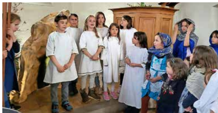
Engel verkünden, dass Jesus lebt. Wie letztes Jahr machen Kinder beim Osteranspiel mit – bei schönem Wetter draussen.

Osternachtsgottesdienst: Samstag, 8. April, 17 Uhr, Kirche Opfertshofen.