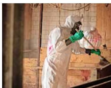
Zivilschützer beim Säubern eines Stalls. Die Bilder lassen unangenehme Erinnerungen an die Coronapandemie hochkommen.

von Thayngen zusammen mit dem Veterinäramt eine Seuchenbekämpfungübung durch. 35 Angehörige des Zivilschutzes, davon 15 Seuchenspezialisten, waren während vier Tagen vor Ort und führten eine möglichst realitätsnahe Säuberungsaktion durch. Von grosser Wichtigkeit war dabei, eine Verschleppung des Erregers zu verhin-