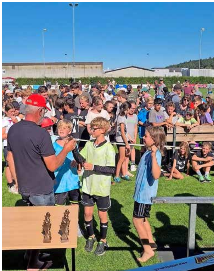
Allen Mannschaften wird an der Rangverkündigung ein Pokal überreicht. Hier den «Rainbow Flames» (Thayngen 5b).

Vom Erstklässler bis zur Sechstklässlerin wurde während der jeweils 13 Minuten Spielzeit mit viel Leidenschaft und Elan alles gegeben. Bei vielen war dies bereits im Vorfeld des Turniers der Fall. Denn diverse Teams hatten eigene Trikots kreiert oder sich gar in Trainingseinheiten auf das Turnier vorbereitet. Wer nach all den Anstrengungen