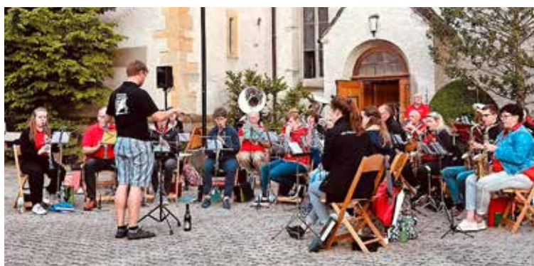
Das Publikum genießt das Beisammensein (oben). Derweil bietet der Musikverein ein abwechslungsreiches Programm (Mitte).

dem melodiosen Stück «Humpa, Humpa» (vielleicht waren Bierhumpen der Vater des Gedankens/ Musikstücks) verabschiedete sich das Korps in die wohlverdiente Pause.