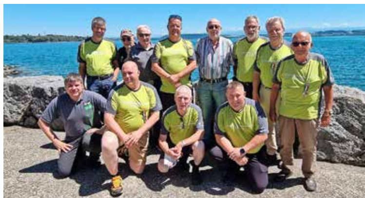
Feldschützen an den Gestaden des Neuenburgersees.