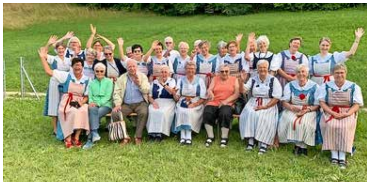
Die Trachtenleute grüssen die zu Hause Gebliebenen.

Die Route und das Ziel blieben bis zum Schluss geheim. Dem verschworenen Vorstand war aber auch gar nichts zu entlocken! Zuerst führte die Fahrt über den Reiat, mit wunderbarem Blick in den Hegau.