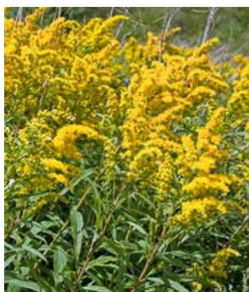
Die Goldrute kommt in dichten Beständen vor.

«In den Dörfern unserer Gemeinde ist die Goldrute von allen invasiven Neophyten die problema-