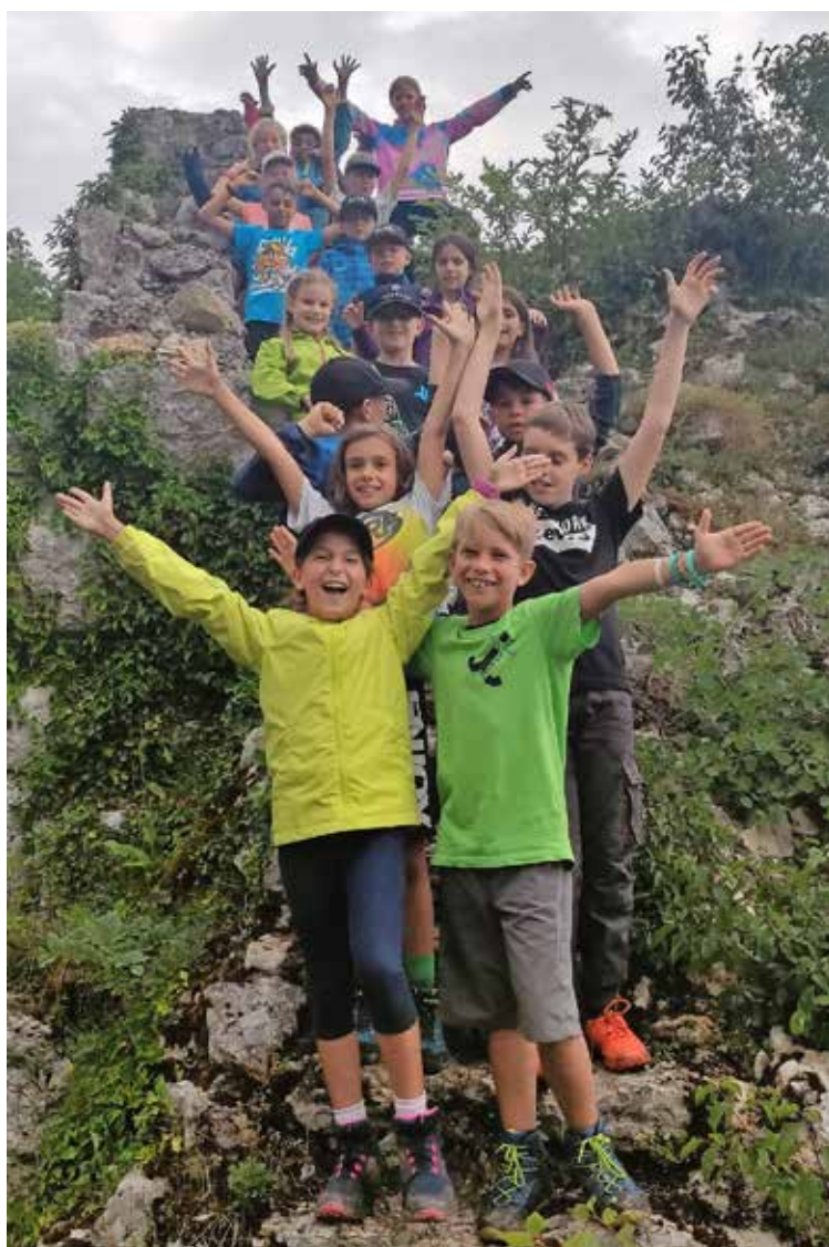
Der Aufenthalt auf der Ruine Radegg macht viel Spass.

Ermattet kamen wir bei der Ruine Radegg an, fanden aber die Energie schnell wieder, als wir sa-