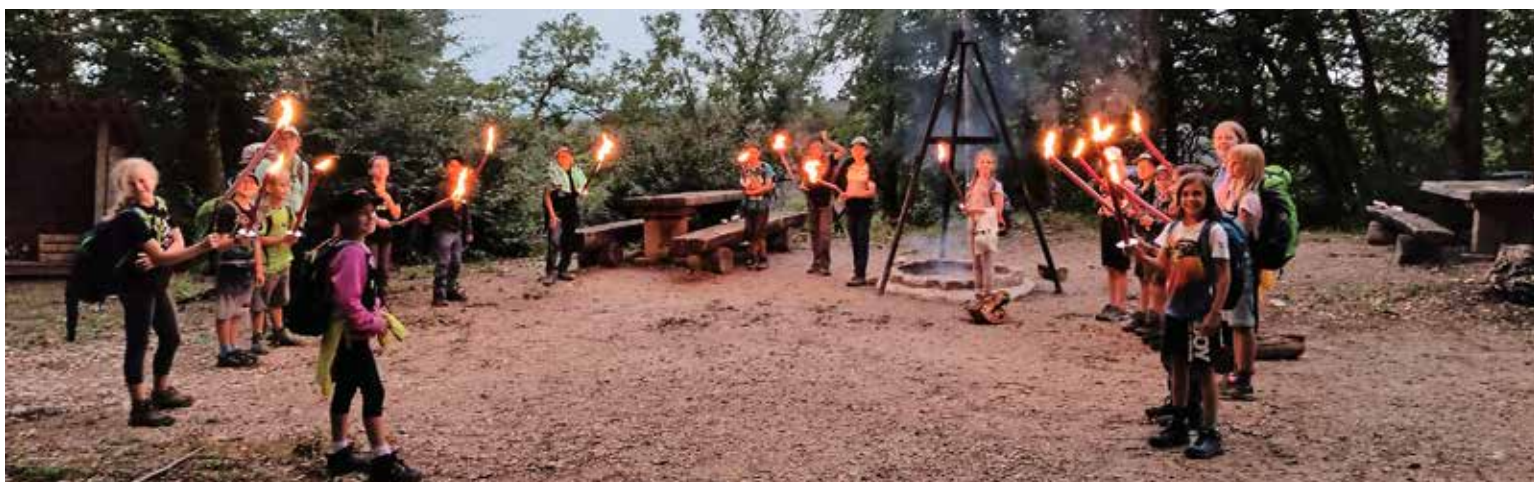
Mit Fackellicht geht es von der Burgstelle zum Übernachtungsort auf dem Rossberghof.

Schülerinnen und Schüler der Klasse 4d, Schulhaus Hammen