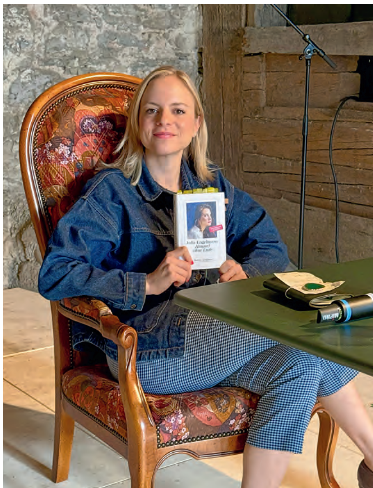
Julia Engelmann bei der Lesung im «Sternen».