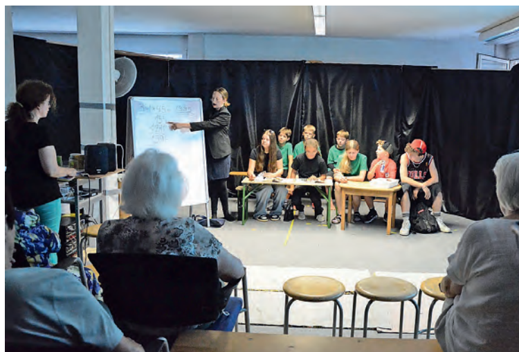
Schülerinnen und Schüler führen ein Musical auf. Darin spielen sie unter anderem die Szene in einem Klassenzimmer nach.

Auch sonst ist in der von einem Verein getragenen Institution vieles in Bewegung. Seit Kurzem ist sie im Besitz eines eigenen Schulbusses, der zum Beispiel Erlebnisausflüge auf