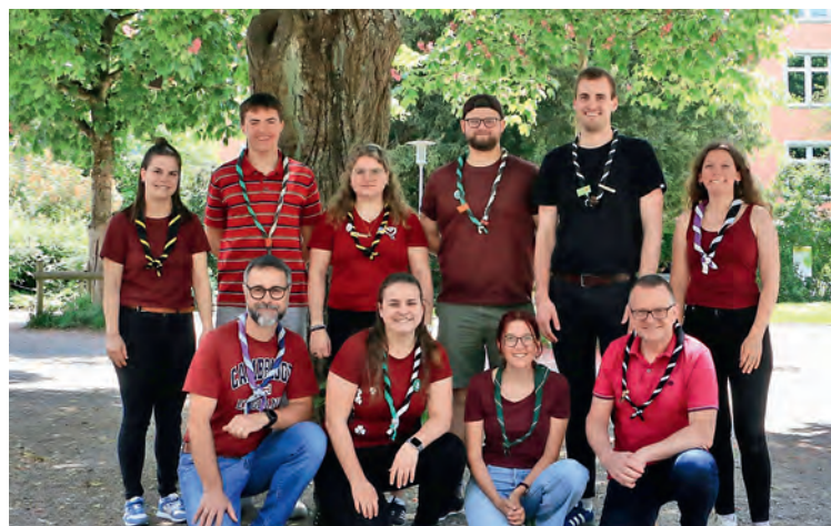
Ein zehnköpfiges Organisationskomitee ist das Kernteam für die Planung und Umsetzung von KaLatan.

ser Pfadis zusammen und haben diskutiert, dass im Kanton 14 Jahre nach dem TakatuKaLand 2012 im Langriet turnusgemäss 2026 wieder ein solches Lager stattfinden sollte. Zu Beginn war die Idee noch ein lustiges Hirngespinnst. So gab es ganz am Anfang noch ein Ressort «Alphorn» fürs