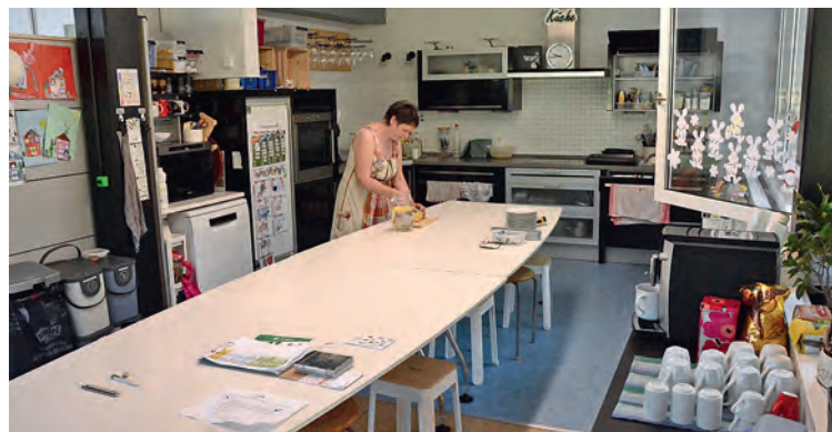
Die Schulküche wird während der Sommerferien umgebaut und auf die Bedürfnisse der wachsenden Schülerschar angepasst.