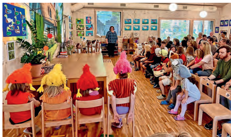
Die Klasse und die Besucherschar sind bereit für die Theateraufführung.