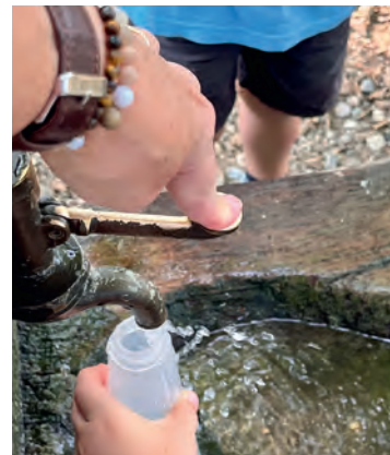
Wasser zum Trinken und Spielen.