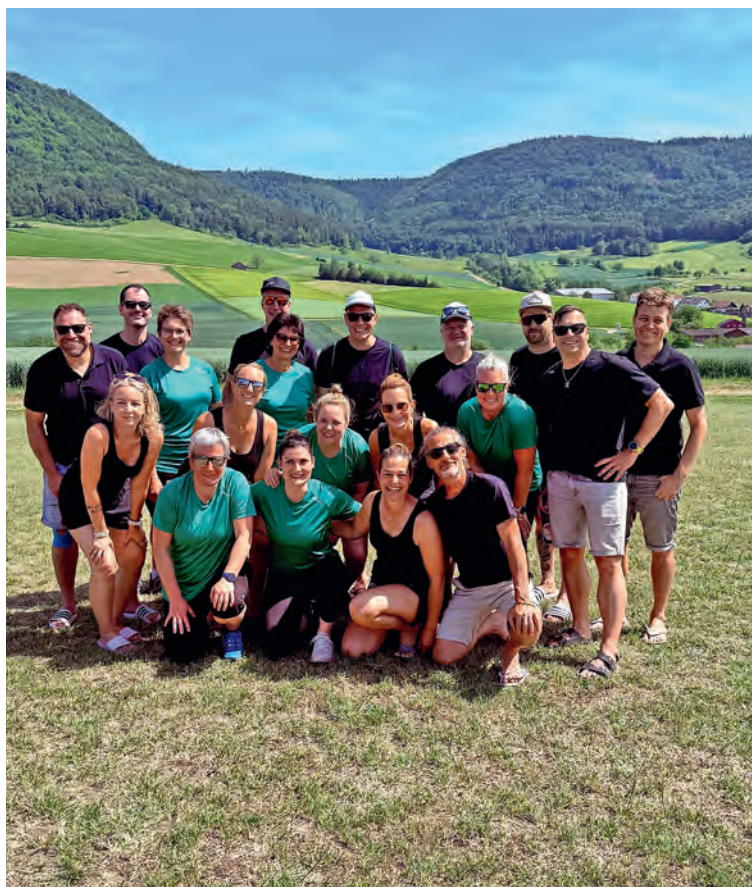
Motivierte Turngruppe aus Thayngen.

BEGGINGEN / ISLIKON TG Am Samstag reiste die Wettkampfgemeinschaft Thayngen 35+ an das Turnfest in Islikon. Trotz sehr grosser Hitze gelang ein sehr erfolgreicher Wettkampf mit teils starken Noten (Steinstossen 9.75, Team Aerobic 9.23 sowie verschiedene gute Fit-&Fun-Wertungen). Mit einer Gesamtpunktzahl im dreiteiligen Wettkampf der dritten Stärkeklasse Männer/Frauen von 26.06 stiessen wir mit einem kühlen Bier oder Aperol auf unseren gelungenen Wettkampf an.