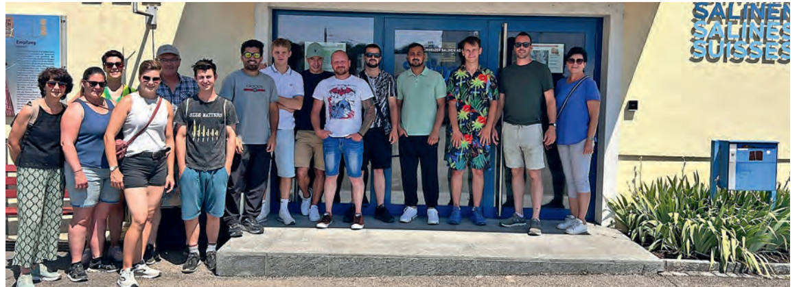
Erinnerungsbild vor dem Empfangsgebäude der Saline Riburg.

BASEL / RHEINFELDEN (AG) Der Auftakt des Ausflugs stand ganz im Zeichen der Entdeckungstour. Ausgerüstet mit Hinweisen und einer guten Portion Spürsinn begaben wir uns auf einen Foxtrail durch die Basler Altstadt. Die abwechslungsreiche Schnitzeljagd führte uns zu zahlreichen Sehenswürdigkeiten und versteckten Ecken der Stadt. Auf der Spurensuche erfuhren wir viel Wissenswertes über die Geschichte und Besonderheiten Basels und konnten die Stadt aus einer ganz neuen Perspektive kennenlernen. Teamarbeit, Kombinationsgabe und eine Prise Abenteuer sorgten dabei für beste Unterhaltung. Sogar ein verlorenges Handy hat dank dem Teamgeist wieder zurück zur Besit-