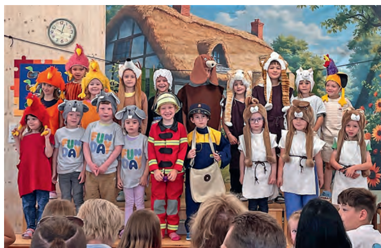
Die Kinder mit ihren Kostümen sind freudig aufgeregt.