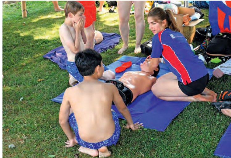
Ein Mitglied der Schweizerischen Lebensrettungsgesellschaft gibt jungen Badi-Gästen im Zürcher Wehntal wichtige Tipps.

Büro: 052 647 66 00 (Mo.–Fr. von 8.00 – 11.00 Uhr) Natel: 079 409 57 56 (Mo.–So. von 7.00–22.00 Uhr) A1733446