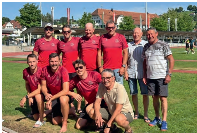
Klein, aber oho: Die Männerriegler aus dem Unteren Reiat

• Das Acht-Mann-Wunder: Im dreiteiligen Vereinswettkampf turnten wir uns konstant und fehlerfrei durch die Hitze. Ergebnis: Eine starke Endnote von 29.04! Das bedeutete Platz 9 von 43 Vereinen. Und