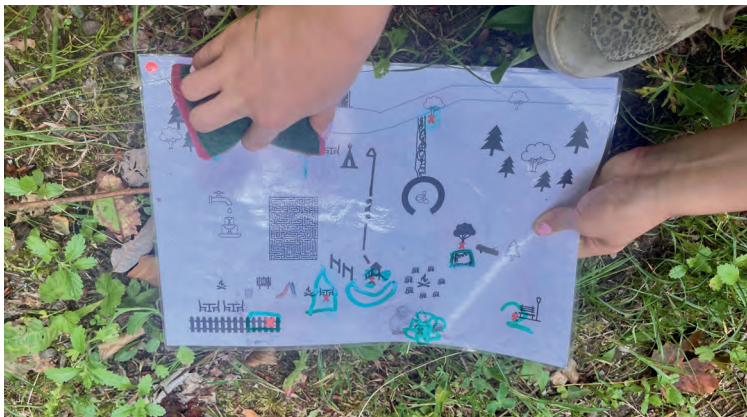
Abwaschbarer Plan der Sommerwaldwoche im Chapf.

Bettina Laich Lehrperson und Koordination Deutsch als Zweitsprache Schule Thayngen