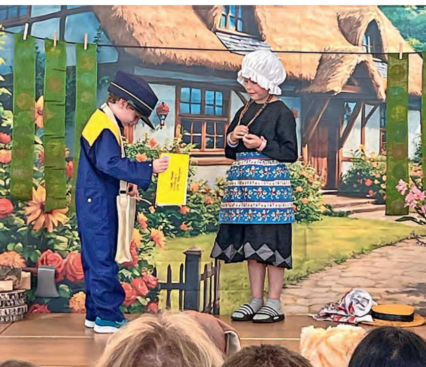
Ein Moment aus dem Theaterstück. Der Pöstler sagt zu Lisette: «Ich habe viele Briefe für dich. Heute ist ein besonderer Tag?»

überrascht wird, mit viel Freude und Engagement als Theaterstück auf. Die eingeladenen Eltern, Geschwister und Grosseltern hatten sichtlich Freude an der aufgeführten Geschichte, den lustigen Kostümen und den vortragenen Liedern. (ak)