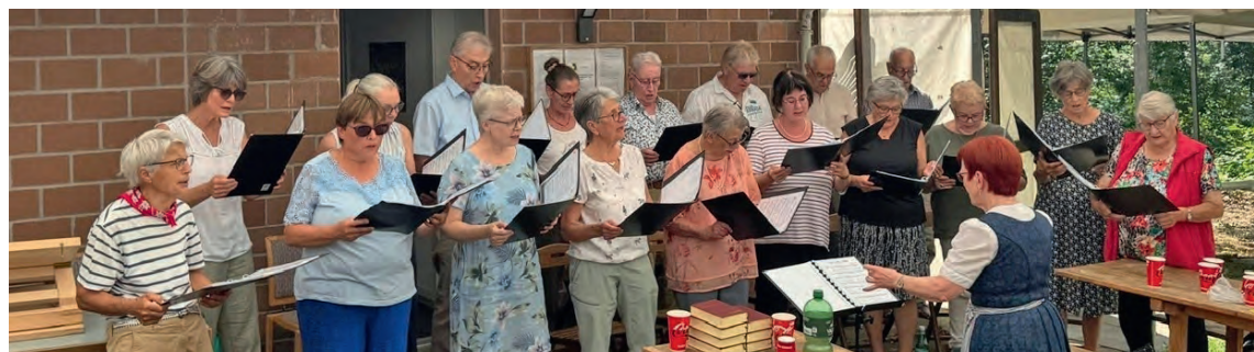
Der Kirchenchor Opfertshofen bei seinem Auftritt neben der Zwetschgenhütte.