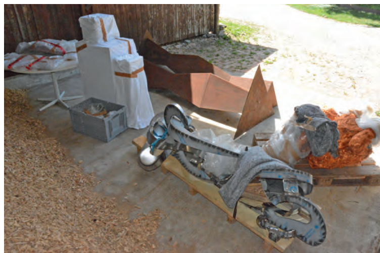
Ein Teil der Kunstwerke liegt im verpackten Zustand in Thayngen bereit und muss noch platziert werden.

Experimentelle in Thayngen: Freitag, 17. Juli, 19 Uhr, Vernissage, Kultur- und Begegnungszentrum Sternen, Thayngen.