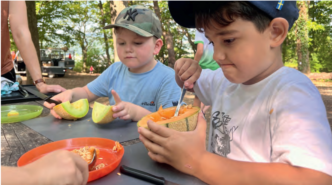
In der Sommerwaldwoche gibt es viel Neues zu lernen, zum Beispiel die Zubereitung von Melonen.