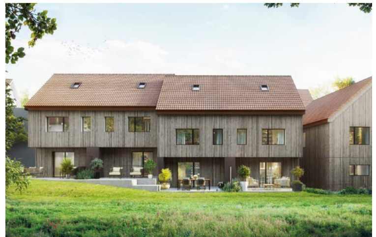
Einfamilienhaus Am Palmenweg: Modern, zentral, naturnah

Ingo Grünig, 052 624 13 13, info@freitagimmo.ch