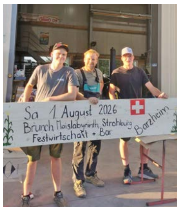
Die Werbetafeln für den Brunch wollen gestaltet sein.