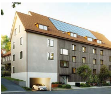
Aussenansicht & Terrasse Eigentumswohnung