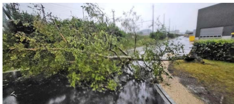
Die Feuerwehr Thayngen rückte am Freitagabend zu zwanzig Einsätzen aus.