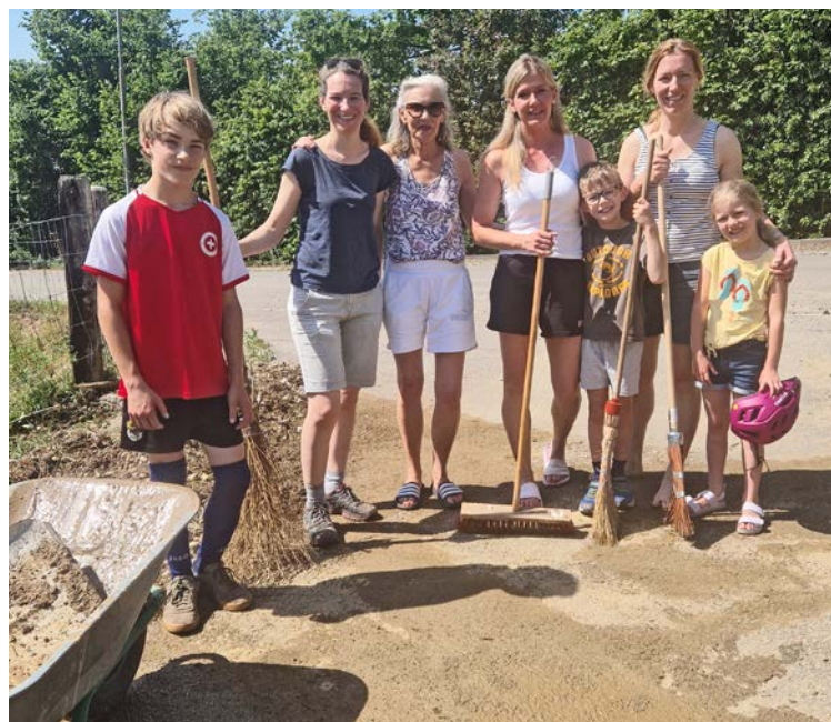
Nachbarschaftshilfe an der Schlattergasse: tatkräftige Frauen und Kinder nach den Aufräumarbeiten.

Am Samstag begannen dann die grossen Aufräumarbeiten. Nachbarinnen mit ihren Kindern von weiter oben und von nebenan rückten mit Schubkarren, Schaufeln und Besen an und halfen, das Geröll auf dem Buechetellenweg wegzuräumen. Ihnen gebührt ein grosses Dankeschön. Ist dies wohl die Bauamtsgruppe von morgen? Da wir bei Starkregen immer dasselbe Problem haben, haben wir uns Frauen gefragt, ob es für die Schlattergasse keine Lösung gibt, welche die Anwohner vor Schäden schützen würde. Wir sind uns bewusst, dass es auch früher bereits Starkregen mit