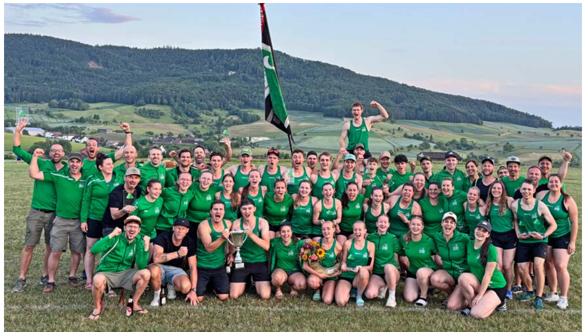
Stolz hält die Thaynger Turndelegation ihre Auszeichnungen in die Höhe.

Kurz darauf stand die Team-Aerobic auf dem Programm. Die Vorzeichen waren vielversprechend und das Ziel war klar: der Kantonalmeistertitel. Leider gelang es uns dieses Mal nicht, einen fehlerfreien Ablauf zu zeigen. Einige kleine Unsicherheiten kosteten wertvolle Notenpunkte, sodass wir unser grosses Ziel leider knapp verpassten. Mit dem