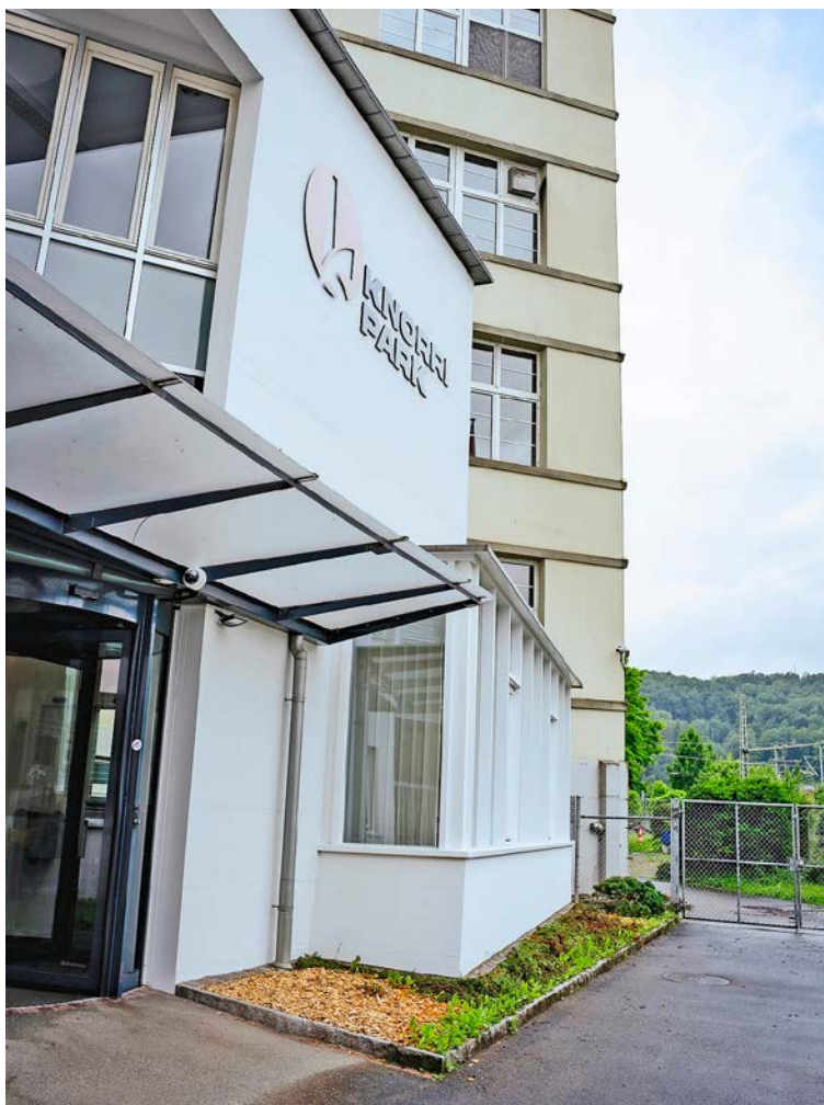
Läuft es nach dem Gemeinderat, nutzt die Gemeinde ab kommendem Frühling leer stehende Unilever-Büros.

Anschliessend ist das eigentliche Projekt an der Reihe, die Sanierung beziehungsweise der allfällige Abbruch und Neubau des Verwaltungsgebäudes, wobei aktuell eine sogenannte Kernsanierung favorisiert wird. Teil des Prozesses wird auch eine Urnenabstimmung sein. Der Einzug in die neuen Räumlichkeiten ist ab 2029 denkbar.