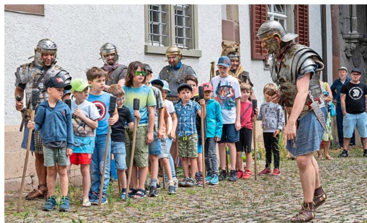
Legionäre geben jungen Männern Einblick in ihr Handwerk.

Sonntag, 28. Juni, Museum zu Allerheiligen, Klosterstrasse 16, Schaffhausen; Eintritt frei; Details: www.allerheiligen.ch