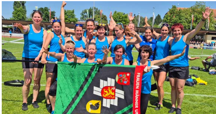
Muntere Turnerinnenschar aus dem Unteren Reiat.

Wir hatten das grosse Glück, einen Startplatz beim Appenzeller Kantonalturnfest zu erhalten. Um halb acht am vergangenen Samstagmorgen trafen wir uns am Bahnhof Thayngen, um gemeinsam nach Herisau zu fahren. Durch das Unwetter am Abend davor fiel der Zug kurzfristig aus und wir organisierten schnell ein paar Autos um nach Feuerthalen zu fahren und dort