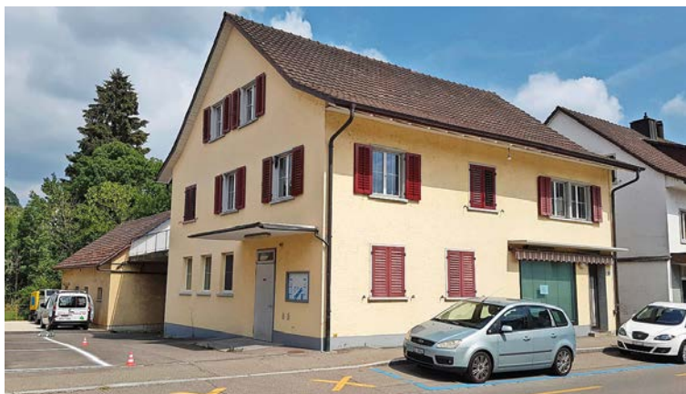
Das ehemalige Gebäude der Milchgenossenschaft an der Biberstrasse 6 vor dem Umbau in den Jahren 2023 und 2024.