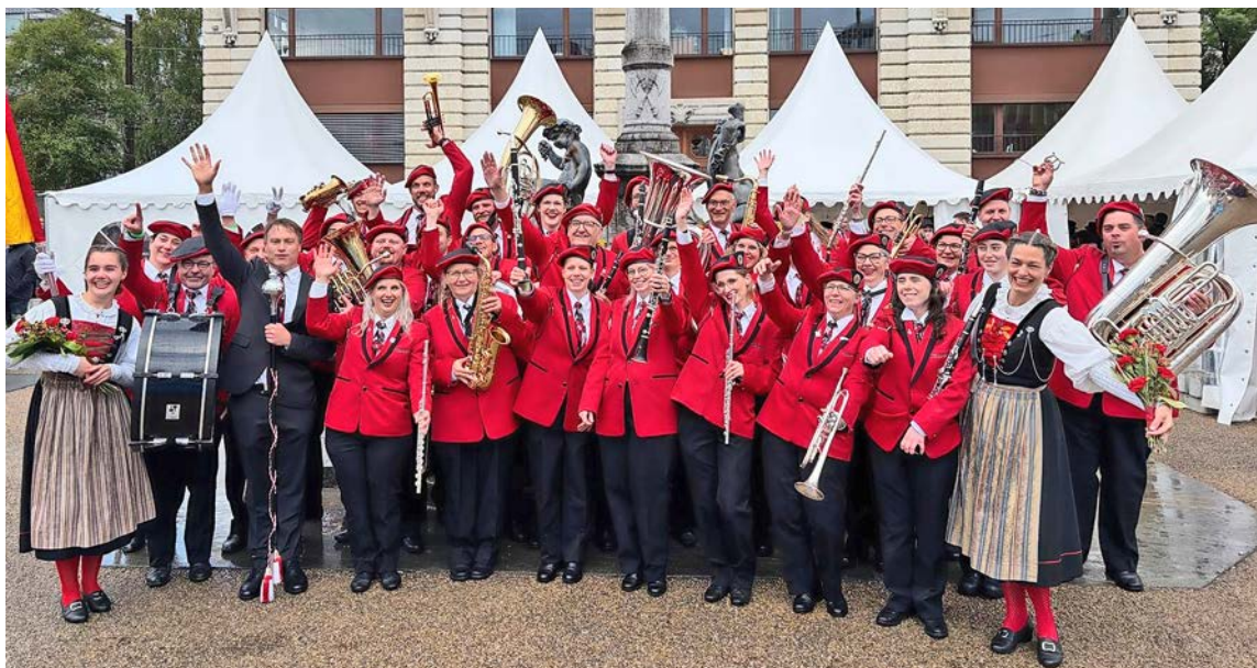
Noch ganz beschwingt von Biel ist der Musikverein bereit für die Thaynger Platzkonzerte.