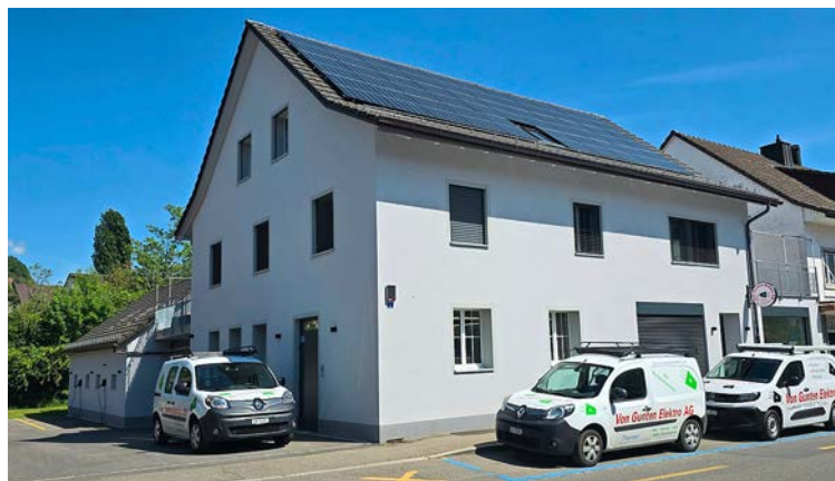
Das renovierte Gebäude mit den Fahrzeugen, die zum Teil mit Strom vom eigenen Dach angetrieben werden.