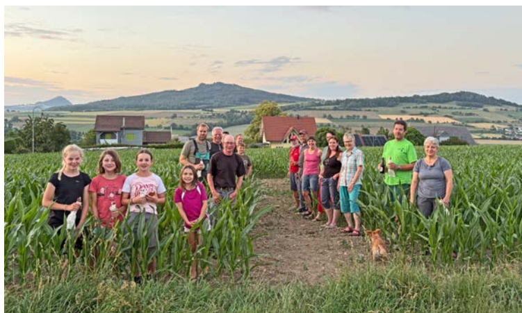
Auf dem Feld wächst das Mais-Labyrinth heran. Wegen des fehlenden Regens sind die Stängel etwas in Rückstand.

Ein besonderes Dankeschön gilt bereits heute unseren zahlreichen Sponsoren. Mit ihrer Unterstützung leisten sie einen wertvollen Beitrag zu unserer Nationalfeier. Dank ihnen ist