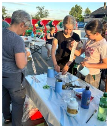
Auch die Tischdekoration gibt einiges zu tun.

es möglich, den Besucherinnen und Besuchern verschiedene Attraktionen anzubieten und gleichzeitig familienfreundliche sowie angemessene Preise zu gewährleisten. Die breite Unterstützung aus der Region zeigt uns, wie wichtig dieser Anlass ist.