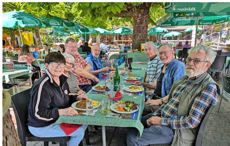
Das Fähnlein der sieben Aufrechten beim Mittagshalt.

Die überaus angenehme Wanderung entlang dem Katzenbach bot viel lebendige Natur: Die Lerche trällerte über goldenen Gerstenfeldern, Milane zogen ihre Kreise am Himmel, ein Storch schwebte auf der Suche nach Beute, und ein Graureiher lauerte auf seine Mahlzeit. Kurze Rast am Büsisee (übrig gebliebener Baggersee neben der Autobahn) zum Auffüllen der Flüssigkeit in unseren Körpern. Nach einem interessanten Gespräch mit einem Ranger zur