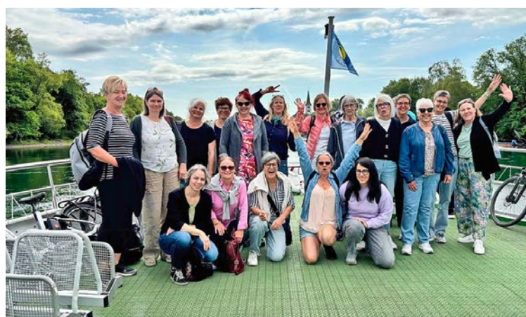
Schifffahrt auf dem Rhein vor dem Umstieg in Diessenhofen.

In Stein am Rhein angekommen, genossen wir mit Blick auf den Rhein lässiges Beachbar-Feeling ... und bei einer Vielfalt orientalischer Vorspeisen (Mezze) auch das ein oder andere Kaltgetränk. So gestärkt, wartete nun die «Mission Mittelalter» auf uns, bei der doch ein wenig detektivisches Gespür gefragt war. Der Trail durch die Gassen der Stadt liess uns in mittelalterliche Geschichte und Geschichten eintauchen, versteckte Ecken und Winkel sowie Details an den wunderschönen Häuserfassaden entdecken.