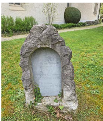
Der Gedenkstein hinter der reformierten Kirche in Thayngen.

Während bei der Bergkirche Hal-lau noch das originale Grabkreuz des Denis Tivel steht, handelt es sich in Thayngen um einen 1902 errichteten