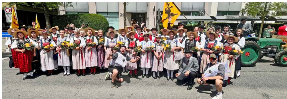
Gut gelaunte Schaffhauser Trachtenleute beim Festumzug.

Bettina Laich Trachtenvereinigung Schaffhausen