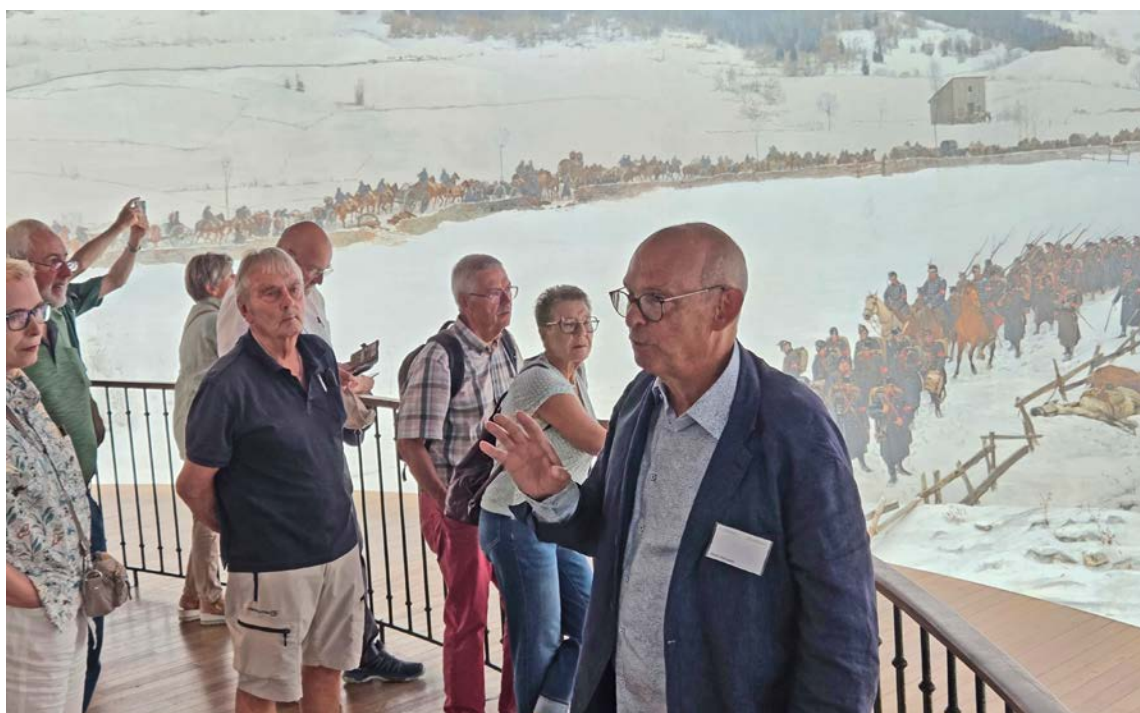
Der junge Ferdinand Hodler war ein begnadeter Soldatendarsteller. Er selbst hat sich in der vordersten Reihe der anmarschierenden Berner Truppen als Zweiter von rechts dargestellt.

Gedenkstein «Le Souvenir Français en Suisse», weil der Grabstein zwei Jahre zuvor bei der Aufhebung des alten Friedhofs rund um die Kirche weichen musste.