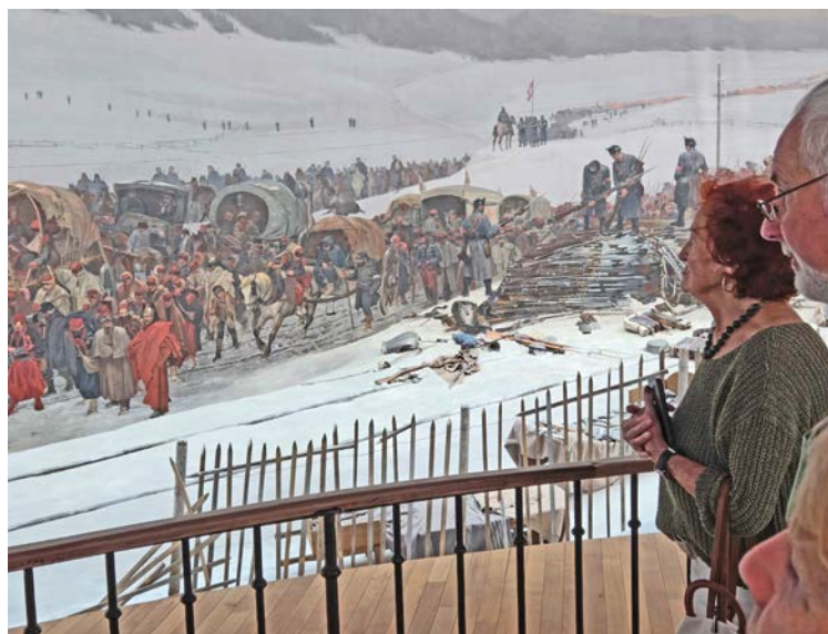
Der Maler Edouard Castres erlebte den Einmarsch der französischen Soldaten als freiwilliger Rotkreuzmitarbeiter persönlich mit und hat sich auf dem Panoramabild verewigt (beim Wagen in der Bildmitte der Mann mit Stock und weisser Armbinde).

tauriert. Das Bourbaki-Panorama ist darum von historischer Bedeutung, weil die Aufnahme der französischen Soldaten wenige Jahre nach der Gründung des Internationalen Komitees vom Roten Kreuz die erste wirklich grosse humanitäre Aktion der neutralen Schweiz gewesen ist und damit eine Tradition begründete, die sich heute in schwierigen Situationen immer wieder neu bewahren muss.