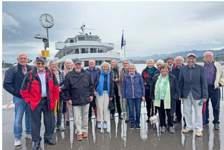
Erinnerungsbild von der Erinnerungsfahrt.

Ein ehemaliger Mitschüler zeigt die Zeichnungs-Sammelmappe, welche er 1956 beim damaligen Lehrer