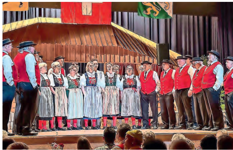
Der Jodelklub Randen Schaffhausen an seinem letztjährigen Chränzli im Reckensaal.

THAYNGEN Der Jodelklub Randen Schaffhausen (JKR) entstand aus einer Fusion. Auf der einen Seite standen die Stadtjodler Schaffhausen, die unter diesem Namen seit 1936 bestanden; gegründet worden waren sie 1926 als Jodel-Doppelquartett Heimelig Schaffhausen. Auf der anderen Seite stand der Jodlerklub Klettgau Siblingen, der 1969 gegründet wurde. Wie aus einer Jubiläumsbroschüre zu entnehmen ist, sind die