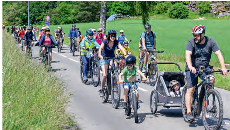
Bei Familien ist der slowUp sehr beliebt.

REGION Mit einem slowUp wird in erster Linie die gesunde, sportliche und umweltfreundliche Mobilität gefördert. In einer touristisch attraktiven Region steht eine asphaltierte Rundstrecke einen Tag all jenen zur Verfügung, die sich mit eigener Kraft auf Rädern, Rollen oder zu Fuss bewegen. Die herrliche Landschaft zwischen Rhein und Hegauvulkanen scheint dafür prädestiniert zu sein. Losgelöst von der Hektik im Alltag entspannt man sich in der freien Natur, geniesst die Vielseitigkeit der Umgebung und tut der eigenen Gesundheit etwas Gutes. Entlang der Strecke darf man sich auf ein kulinarisch, kulturell und sportlich vielfältiges Rahmenprogramm freuen, das von den Vereinen und Gemeinden in eigener Regie gestaltet wird. Der Kreativität sind diesbezüglich keine Grenzen gesetzt.