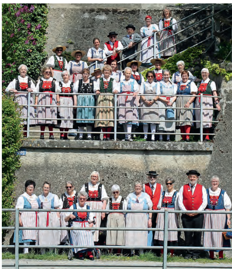
Die Trachtenleute sind so bunt wie die aktuell blühende Natur.

Zurück an Bord gab es ein feines Mittagessen, während die Fahrt