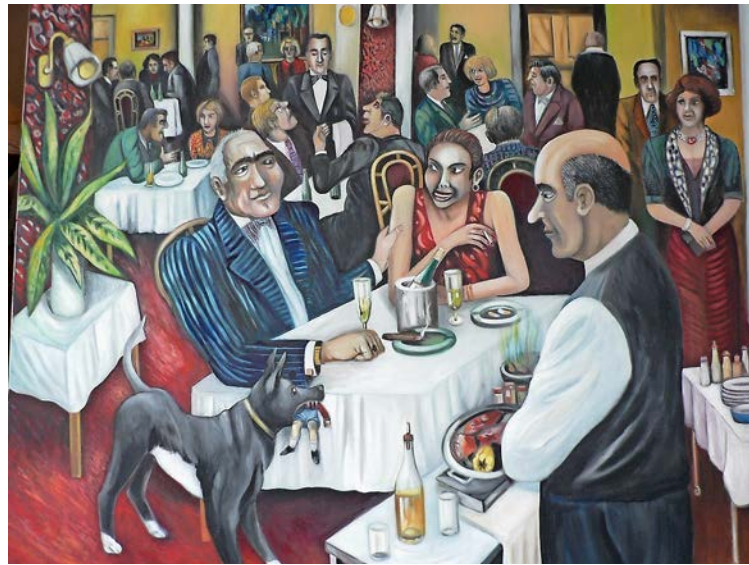
«Man trifft sich»: Das Gemälde stammt aus dem Jahr 2004 und ist im Original 100 mal 100 Zentimeter gross; Öl auf Nessel.

Ein Aspekt, der heute noch deutlicher hervortritt, ist der politische. Kvpils Bilder nähren sich aus Erfahrungen von Repression und dem Leben in totalitären Regimen. Die Ereignisse des Prager Frühlings vor über fünfzig Jahren zwangen ihn, aus der Tschechoslowakei zu fliehen. Damit wurde er im Westen, wie viele andere Dissidenten und Künstler, Sprachrohr