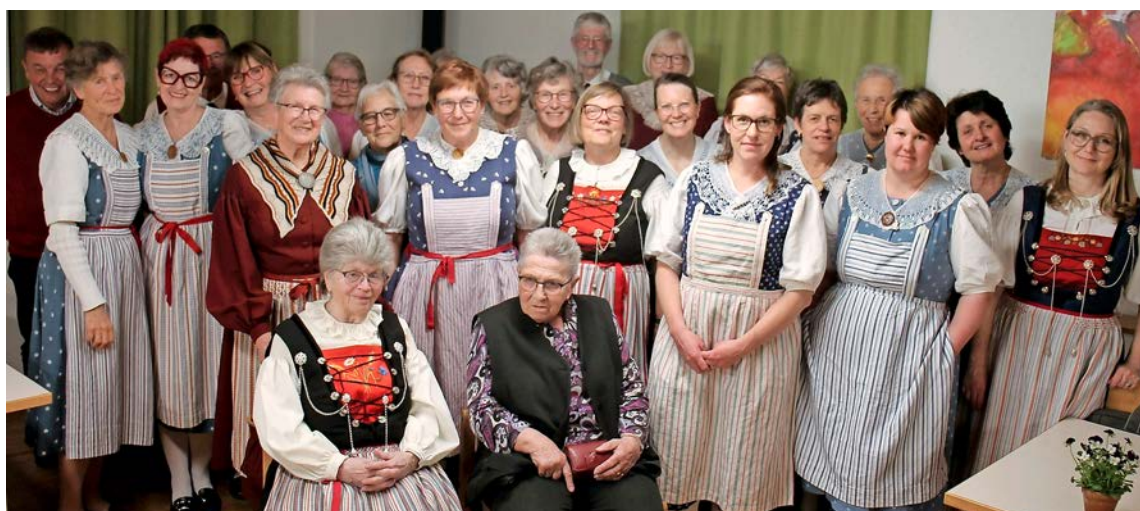
Mit Schurz und Strumpf: Die Mitglieder der Trachtengruppe Reiat an ihrem Jahresbott.