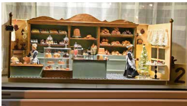
Das zweite Adventstürchen «öffnet sich» bei der Familie Hänggi in der Biberstrasse 22. Rechts ist der «kleine Wegweiser» zu sehen.

Da laden fantasievolle Themen wie die «Erdmännchen-Weihnacht» oder die «Weihnachtliche Weidenkugel» zum Vorbeikommen und Verweilen ein. Aber auch auf einen Apéro und auf heisse Getränke können Sie sich freuen. So bietet die Pfadi zwischen 18 und 20 Uhr Suppe, Punsch und Tee an. Weitere Überraschungen haben unter anderem die Stiftung Sternen & Kulturverein Thayngen und die Feuerwehr