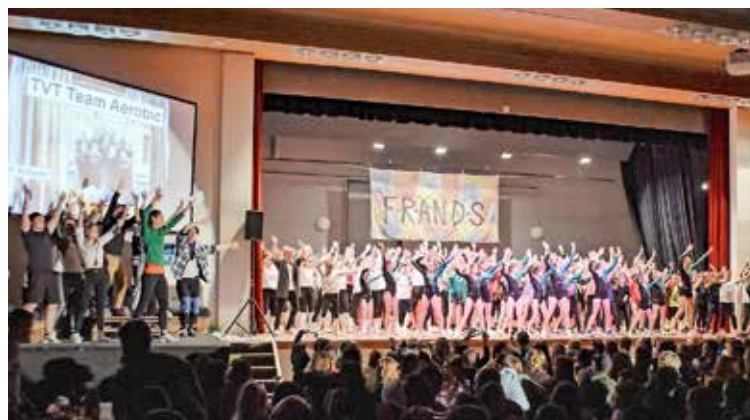
Die hoch motivierten Turnerinnen und Turner an ihrem Auftritt im Reckensaal nach der auferlegten Pause von zwei Jahren.

In der Pause gab es, wie es sich für ein richtiges Chränzli gehört, leckere Speisen aus der Küche. Bei Hamburger, Kaffi-Lutz und einem