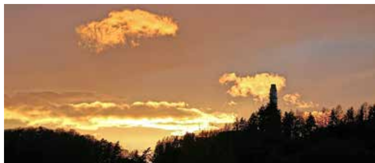
Blick am Samstagabend auf den Kamin der ehemaligen «Zemänti».