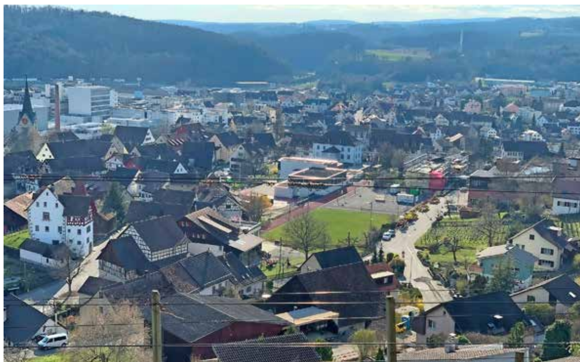
Aussicht mit Weitsicht, passend zum Thema der SVP-Feierabendwanderung.

THAYNGEN Nachdem die diesjährigen Sommerferien schon bald wieder passé sind, kehren wir mehr und mehr in den Alltag zurück und setzen uns wieder mit alltäglichen Themen auseinander. In den letzten Wochen hat sich auch in Thayngen einiges bewegt. Beispielsweise sind der Abbau von Arbeitsplätzen bei Unilever, mögliche Neuansiedlungen von Firmen, Änderungen des Wirtschaftsförderungsgesetzes gemäss der Abstimmungsvorlage vom 30. August ein Thema oder auf Gemeindeebene die Bevölkerungsentwicklung, die Schulraumplanung, Sicherheit und das Verkehrsaufkommen oder das Seniorenzentrum. Wir bieten Ihnen die Möglichkeit, die oben genannten, topaktuellen Themen mit unseren Kandidaten, aber auch mit der