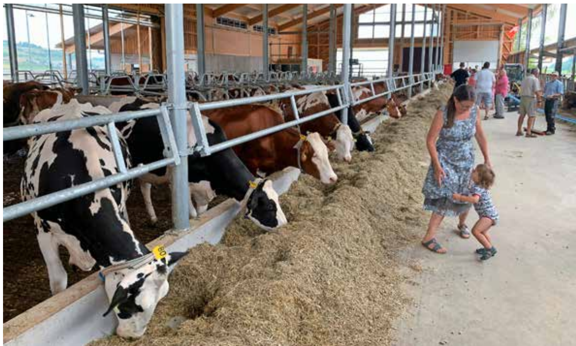
Der im März bezogene neue Boxenlaufstall bietet Platz für 90 bis 100 Kühe.

Eine gemeinsame Zukunft haben die beiden Parteien im neuen Stall ausserhalb des Dorfes gefunden, dessen Bau im August letzten Jahres in Angriff genommen und im März dieses Jahres fertiggestellt wurde. Den Stall in Auftrag gegeben hat das Ehepaar Sonderegger, das