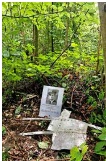
Foto am Fundort des toten Piloten. Daneben ein Wrackteil des Lancaster-Bombers.

In den Recherchen zeichnete sich ab, dass nach dem Absturz